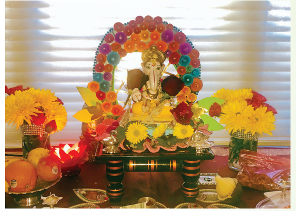
दुसरा क्रमांक गिरीजा मनोहर